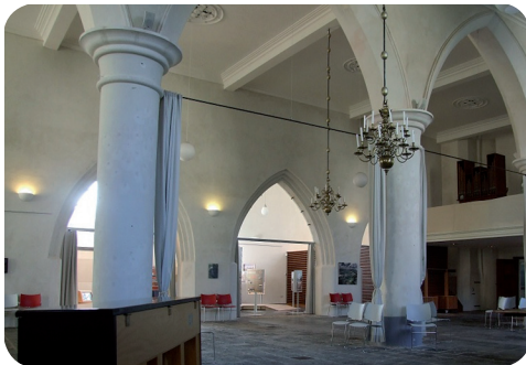
Grote Kerk van Groede