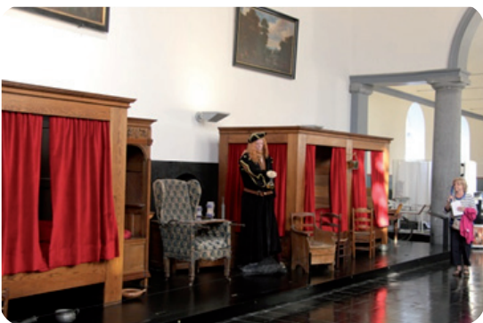
Hôpital Notre Dame à la Rose (Lessines)