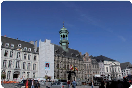
Belfort van Bergen (Mons)

De KOKW nodigt haar leden en sympathisanten graag uit voor haar jaarlijkse uitstap op 26 april 2014.